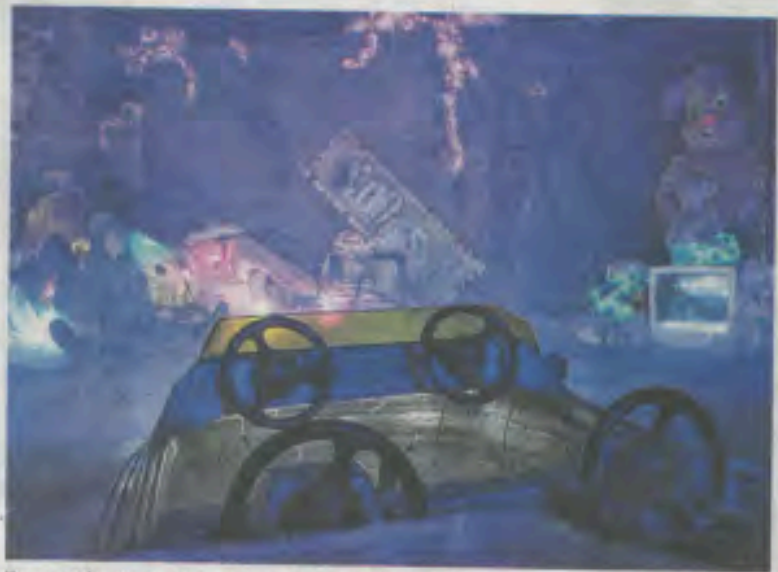
Un spectacle « immersif » qui ne peut laisser indifférent. Violaine Fimbel

Souvent plongé dans la pénombre, le public se sent parfois oppressé, surtout lorsqu'il se trouve dans l'abri qui ressemble à un vieux transformateur électrique sans issue. Une sorte de squat, encombré de sacs poubelles noirs et de vieux jouets, où un